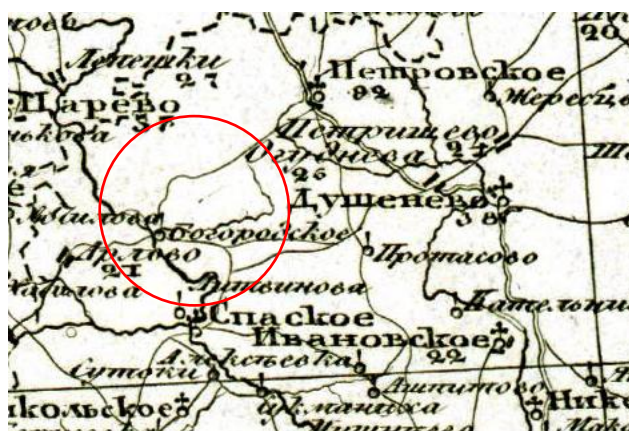
Спец карта Зап. части России Г.Л. Шуберта, 1840 г.

Городской округ Щелково включает особо охраняемые природные территории. Значительную площадь территории занимают планируемые особо охраняемые природные территории, среди которых заказник «Душоновские болота» (1400 га) и памятник природы «Никольская лесная дача» (1162 га), а также планируемые природные экологические территории регионального значения – ключевые и транзитные территории.