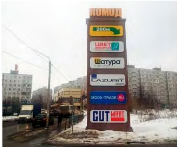
188. г. Щелково, пересечение Пролетарского проспекта и ул.Гребенская гора, напротив д. 18С1, стела о/с, 10,0 x 2,0 м, внутренний подсвет, сторона А