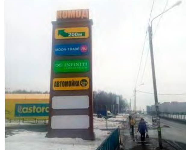
188. г. Щелково, пересечение Пролетарского проспекта и ул.Гребенская гора, напротив д. 18С1, стела о/с, 10,0 x 2,0 м, внутренний подсвет, сторона Б