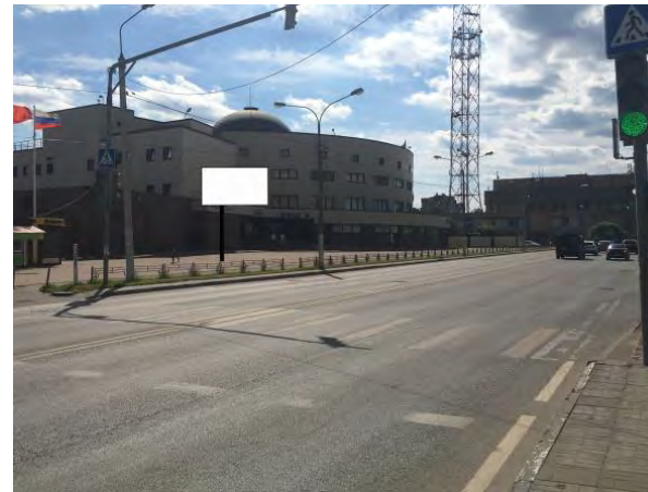
427. г. Щёлково, ул. Талсинская, д. 1а (поз.1) светодиодный экран о/с, 3 x 6 м, сторона Б