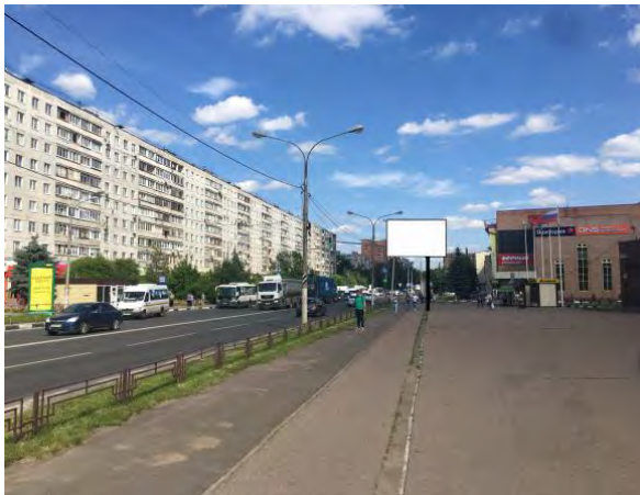
427. г. Щёлково, ул. Талсинская, д. 1а (поз.1) светодиодный экран о/с, 3 x 6 м, сторона А