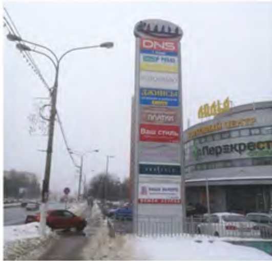
27. г. Щёлково, Пролетарский пр-кт, между домами 5 и 5а, вблизи дома 4 корп.3, стела о/с, 11,23 x 2,64 м, сторона А