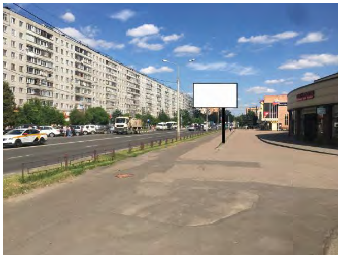
428. г. Щёлково, ул. Талсинская, д. 1а (поз.2) щит о/с, внутренний подсвет, 3 x 6 м, сторона А