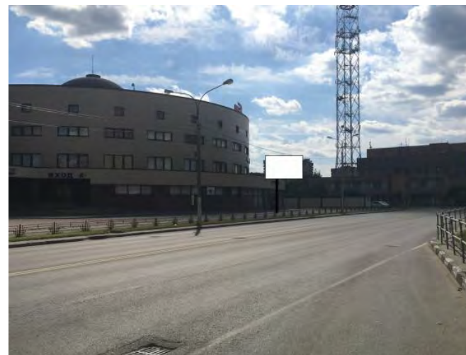
428. г. Щёлково, ул. Талсинская, д. 1а (поз.2) щит о/с, внутренний подсвет, 3 x 6 м, сторона Б