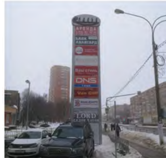
27. г. Щёлково, Пролетарский пр-кт, между домами 5 и 5а, вблизи дома 4 корп.3, стела о/с, 11,23 x 2,64 м, сторона Б