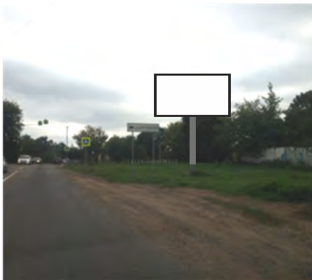
98. г. Щёлково, ул. Заводская перед поворот. на ул. Рудакова, справа; щит о/с, 3 х 6, сторона А