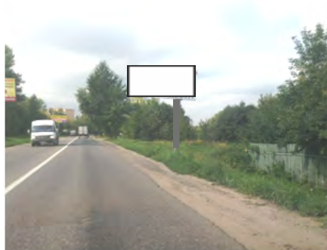
97. г. Щёлково, ул. Рудакова, 50 м до поворот на мост к ЖБК, слева; щит о/с, 3 х 6, сторона А