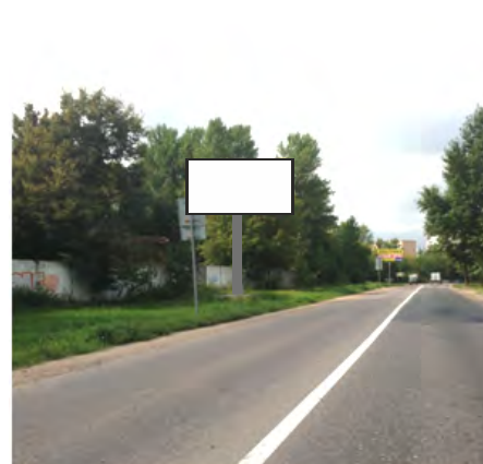
96. г. Щёлково, ул. Рудакова, напротив д.7 по ул. Стефановского; щит о/с, 3 х 6, сторона Б