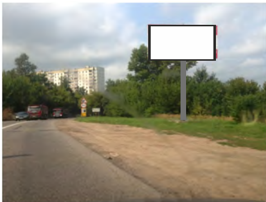
94. г. Щёлково, ул. Рудакова, 300 м от поворот на мост ЖБК, слева; щит о/с, 3 x 6, сторона А