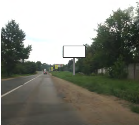
96. г. Щёлково, ул. Рудакова, напротив д.7 по ул. Стефановского; щит о/с, 3 х 6, сторона А