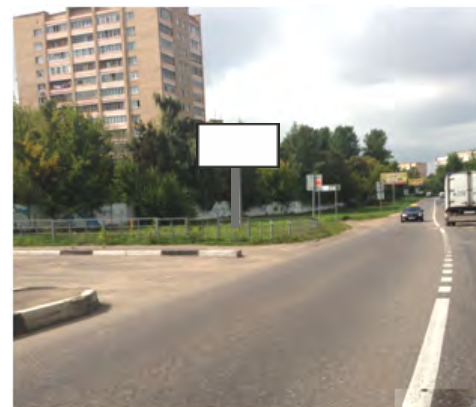
98. г. Щёлково, ул. Заводская перед поворот. на ул. Рудакова, справа; щит о/с, 3 х 6, сторона Б