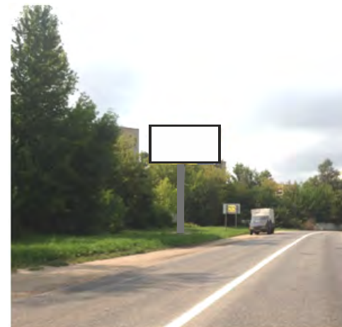
95. г. Щёлково, ул. Рудакова, напротив д.5 по ул. Стефановского; щит о/с, 3 x 6, сторона Б