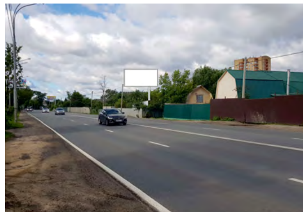
421. городской округ Щёлково, д. Медвежьи Озёра, уч. 20 щит о/с, 3 х 6, внутренний подсвет, сторона Б