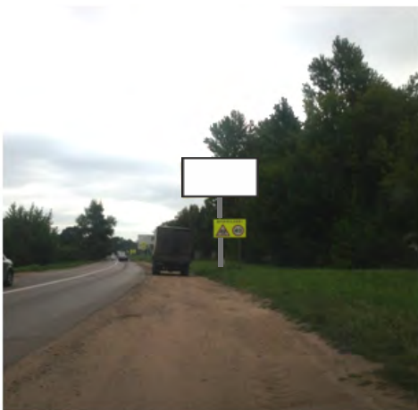
95. г. Щёлково, ул. Рудакова, напротив д.5 по ул. Стефановского; щит о/с, 3 x 6, сторона А