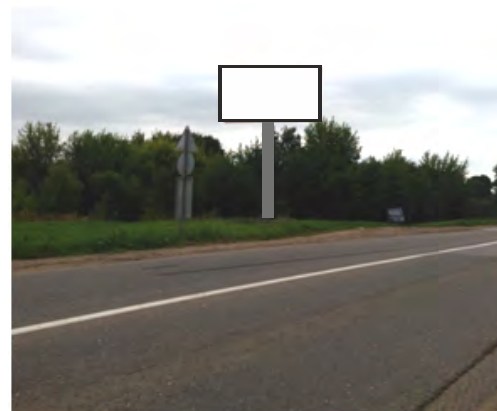
94. г. Щёлково, ул. Рудакова, 300 м от поворот на мост ЖБК, слева; щит о/с, 3 x 6, сторона Б