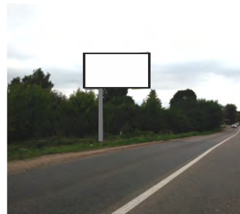
97. г. Щёлково, ул. Рудакова, 50 м до поворот на мост к ЖБК, слева; щит о/с, 3 х 6, сторона Б