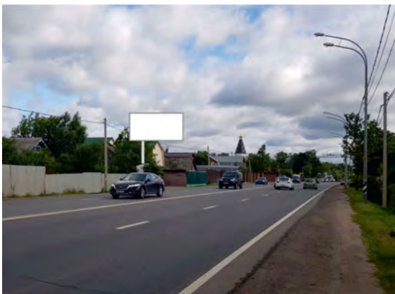
421. городской округ Щёлково, д. Медвежьи Озёра, уч. 20 щит о/с, 3 х 6, внутренний подсвет, сторона А