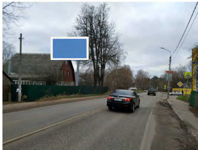
430. Щёлковский р-н, дер. Серково, д. 45, щит о/с, внутренний подсвет, 3,0 x 6,0 м, сторона Б