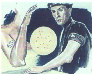
Обострение бруцеллеза (артрит)