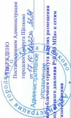
СХЕМА ГРАНИЦ ПУБЛИЧНОГО СЕРВИТУТА В ГРАНИЦАХ ЗЕМЕЛЬНОГО УЧАСТКА С КАДАСТРОВЫМ НОМЕРОМ 50:14:0030417:79

Объект: подземные линейные сооружения (газопровод низкого давления Р≤0,003МПа) Местоположение/кадастровый номер: обл. Московская, р-н Щелковский, снт "Полет" (ЗУ с КН 50:14:0030417:79) Площадь земельного участка: 84 кв.м