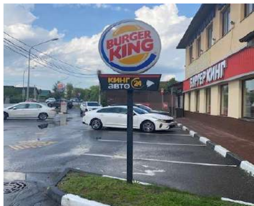
475. Московская область, г.о. Щелково, д. Медвежье Озера, д. 93А, стела о/с, 1,18 x 0,9 м, h-3,0 м, внутренний подсвет, сторона А