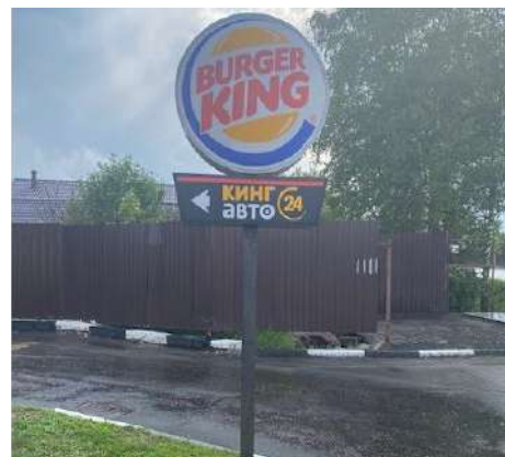
475. Московская область, г.о. Щелково, д. Медвежье Озера, д. 93А, стела о/с, 1,18 x 0,9 м, h-3,0 м, внутренний подсвет, сторона Б