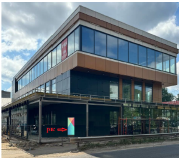
474. Московская обл., г.о. Щёлково, р.п. Монино, Железнодорожная ул., вблизи стр. 31А, пилон о/с, 2,2 x 0,91 м, экран, сторона А