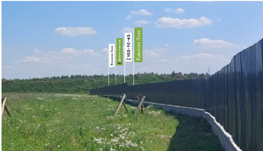
473. Московская обл., г.о. Щёлково, д. Аксиныно, Полевая ул., з/у 25, флаговая композиция - 4 эл, о/с, 4,5 x 1,5 м, h - 9,0 м без подсвета, сторона А