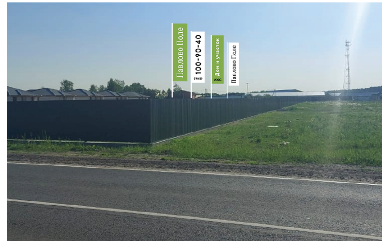
473. Московская обл., г.о. Щёлково, д. Аксиныно, Полевая ул., з/у 25, флаговая композиция - 4 эл, о/с, 4,5 x 1,5 м, h - 9,0 м без подсвета, сторона Б