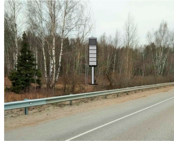
424. Щёлковский р-н, СПК "Новое Литвиново". стела о/с, внутренний подсвет, 12 х 2 м, сторона Б