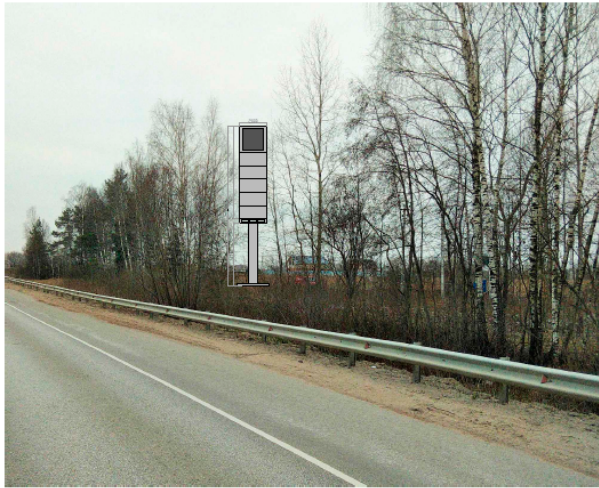
424. Щёлковский р-н, СПК "Новое Литвиново". стела о/с, внутренний подсвет, 12 х 2 м, сторона А