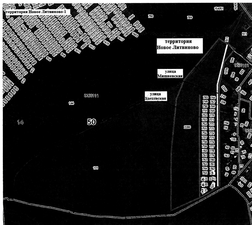
Схема расположения элемента планировочной структуры – территория Новое Литвиново и элементов улично-дорожной сети – улица Мишневская, улица Здоховская, расположенных в городском округе Щёлково Московской области

Начальник отдела архитектуры и градостроительства Управления строительного комплекса Администрации городского округа Щёлково