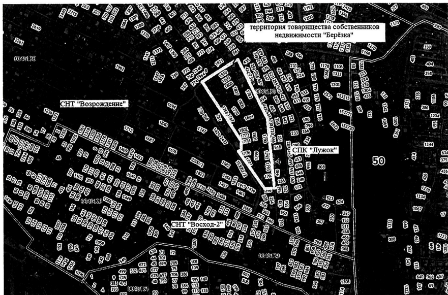
Схема расположения элементов планировочной структуры – территория товарищества собственников недвижимости «Берёзка», в кадастровом квартале 50:14:0040130 городского округа Щёлково Московской области

Начальник отдела архитектуры и градостроительства Управления строительного комплекса Администрации городского округа Щёлково