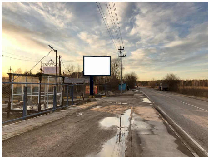
425. Щелковский район, деревня Никифорово (в районе д. 136), щит малый о/с, внутренний подсвет, 3 x 4 м, сторона А