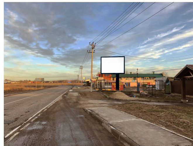
425. Щёлковский р-н, деревня Никифорово (в районе д. 136), щит малый о/с, внутренний подсвет, 3 x 4 м, сторона Б