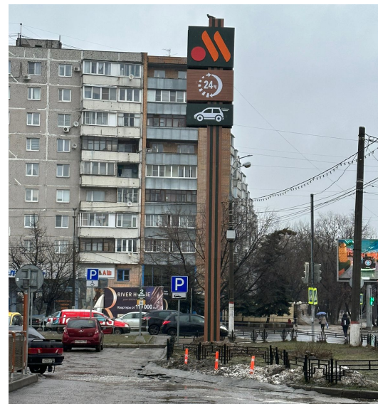
47. г. Щёлково, Пролетарский пр-т, д. 9/1, стела о/с, 4,11 x 1,92 м, h-14,0 м, внутренний подсвет, сторона Б