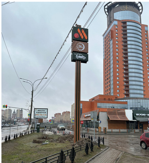
47. г. Щёлково, Пролетарский пр-т, д. 9/1, стела о/с, 4,11 x 1,92 м, h-14,0 м, внутренний подсвет, сторона А