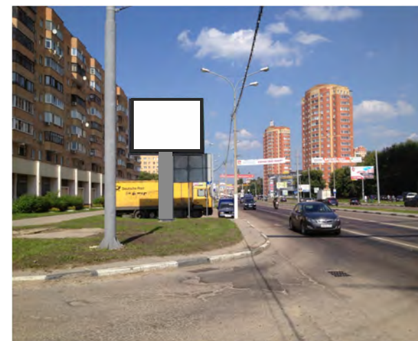
72. г. Щёлково, Пролетарский пр-т, д.3; ситиборд о/с, 2,7 х 3,7 м, сторона Б