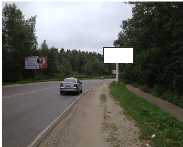
71. а/д Фряновское ш-се, 08 км 900 м, справа; щит о/с, 3 х 6 м, сторона А