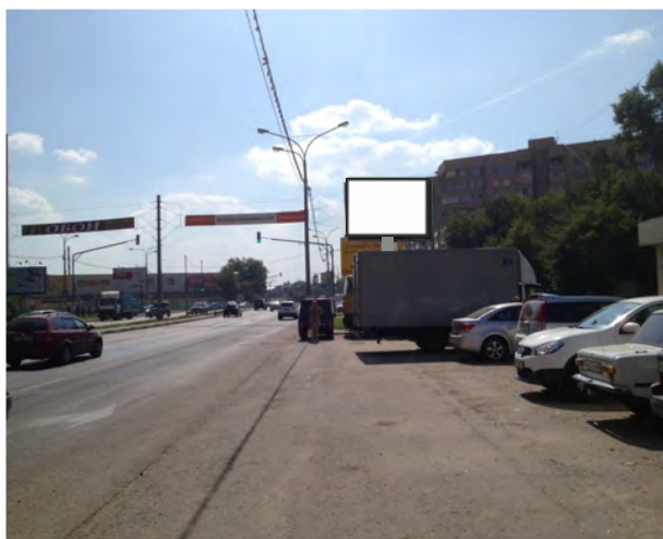
72. г. Щёлково, Пролетарский пр-т, д.3; ситиборд о/с, 2,7 х 3,7 м, сторона А