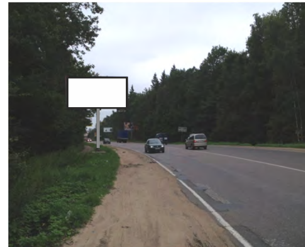
71. а/д Фряновское ш-се, 08 км 900 м, справа; щит о/с, 3 х 6 м, сторона Б