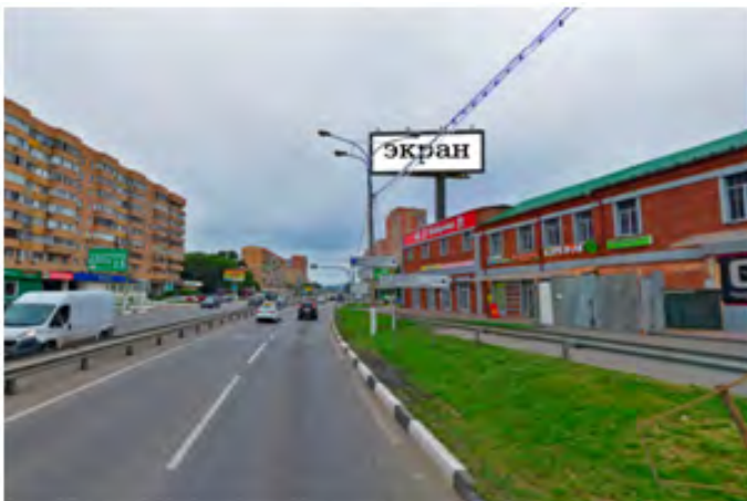
442. г. Щёлково, ул. Советская, д. 16, светодиодный экран, о/с, 4,0 x 12,0 м, сторона А