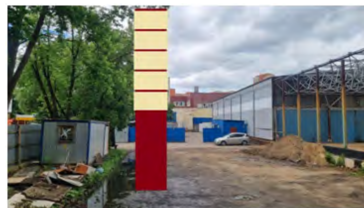
443. г. Щёлково, ул. Краснознаменская, д. 2, стела, о/с, 9,5 x 2,0 м, внутренний подсвет, сторона Б