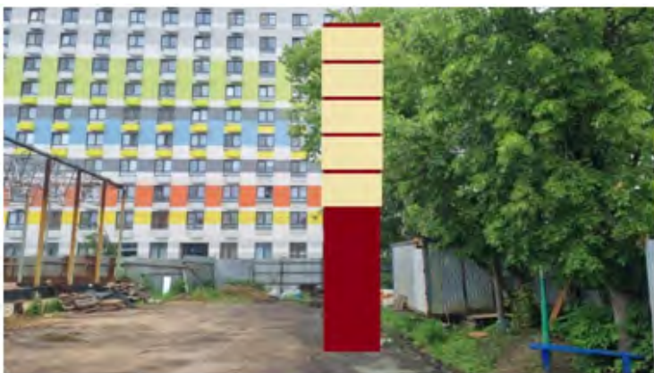
443. г. Щёлково, ул. Краснознаменская, д. 2, стела, о/с, 9,5 x 2,0 м, внутренний подсвет, сторона А