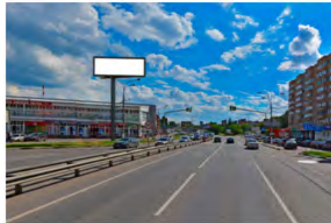
442. г. Щёлково, ул. Советская, д. 16, светодиодный экран, о/с, 4,0 x 12,0 м, статика (внешний подсвет) - сторона Б